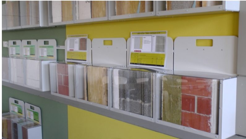
Abb. 3: Handmodelle von Wand- und Dachaufbauten

umgebauter Kühlschrank mit Fenstern unterschiedlicher energetischer Standards, eine einfache Versuchsanordnung zu Messung der Wärmedurchlässigkeit unterschiedlicher Dämmmaterialien sowie ein Aufbau zur haptischen Wahrnehmung der Wärmeleitfähigkeit verschiedener Bodenplatten zur permanenten Ausstattung des Unterrichtsraums.