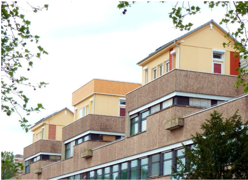
Abb. 2: Pavillons

In die Pavillons sind 380 Sensoren verbaut, die u.a. folgende Messungen und Bewertungen erlauben: